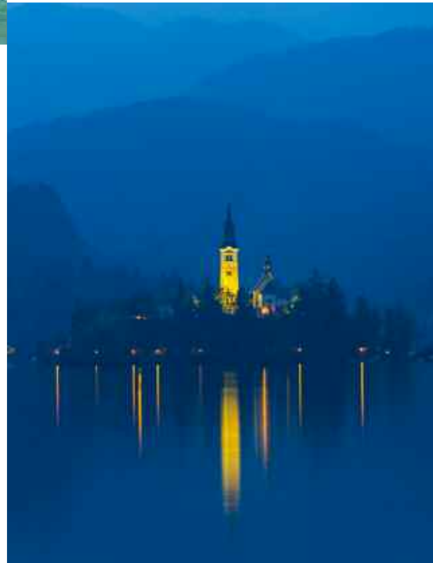
(Izq.) Sugerente imagen del lago Bled con la iglesia iluminada. (Dcha. Arr. y Ab.) Lago Bohinj y rótulos situados en el teleférico de Vogel.

norte (y que es el más antiguo del país) acaba de añadir encanto al idílico lago. Todo eso, además de su clima de montaña, contribuyó, sin duda, a convertir a la ciudad y su entorno en uno de los primeros lugares de veraneo alpino en Europa. Si llegáis hasta aquí tenéis que probar el famoso pastel de crema de la ciudad, el kremna rezina . Con él y con estas magníficas vistas acabamos nuestra placentera ruta por las montañas eslovenas. ♦